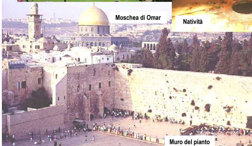
Moschea di Omar